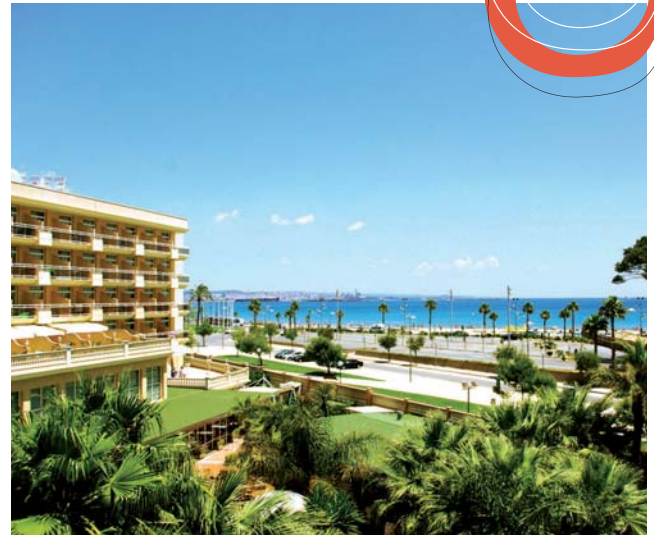
HOTEL PALAS PINEDA **** à La Pineda / Salou / Vila Seca

L'hôtel occupe une position très centrale, à 100 m de la plage. Le centre touristique de la Pineda situé sur la Costa Dorada n'est qu'à 100 m. Des zones commerçantes avec des boutiques, des restaurants et des bars se trouvent à proximité. Les transports en commun passent juste devant l'hôtel. Ce complexe hôtelier dispose d'un terrain de 20000 m 2 et compte 452 chambres réparties dans 3 bâtiments. Il propose à ses clients un hall d'accueil impressionnant avec une coupole de verre haute de 16 m, de larges fenêtres et des escaliers monumentaux.