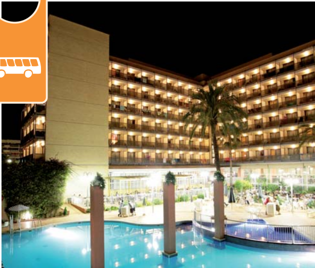
HOTEL EUROSALOU *** à Salou

Cet hôtel rénové, avec un magnifique espace spa, se trouve dans un quartier tranquille du centre-ville, facile d'accès à la plage, à Port Aventura. L'hôtel est décoré dans un style moderne mais décontracté, c'est l'endroit idéal pour se détendre dans un cadre élégant.