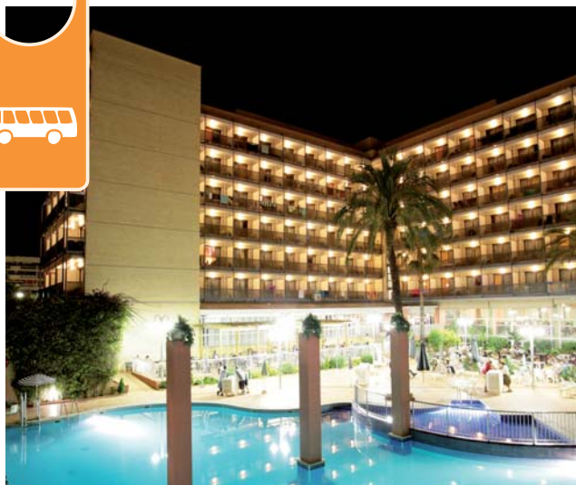
HOTEL EUROSALOU *** à Salou

Cet hôtel rénové, avec un magnifique espace spa, se trouve dans un quartier tranquille du centre-ville, facile d'accès à la plage, à Port Aventura. L'hôtel est décoré dans un style moderne mais décontracté, c'est l'endroit idéal pour se détendre dans un cadre élégant.